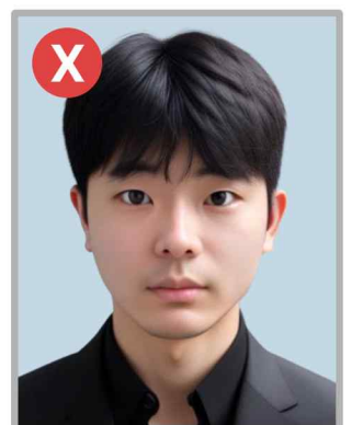
SI 프로필 사진