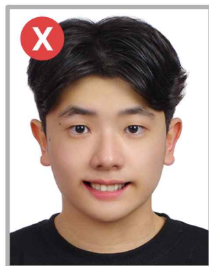
치아가 보이는 사진