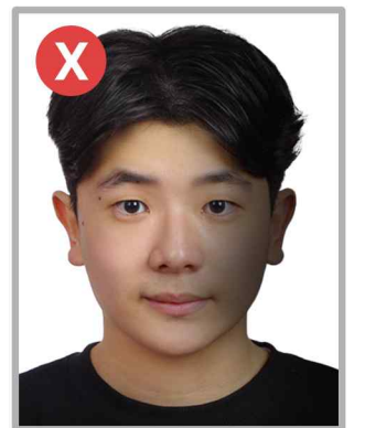
그림자(또는 얼굴 음영)