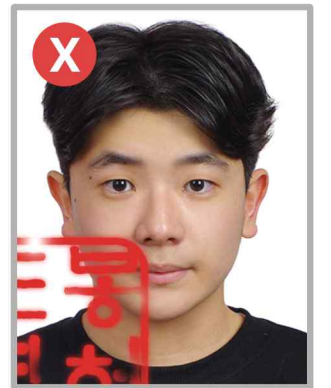
압인 등이 찍힌 사진