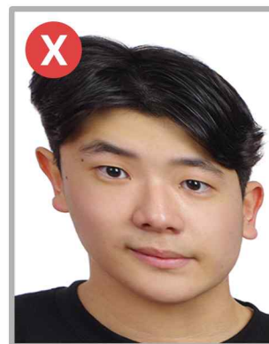
얼굴 방향 및 어깨선