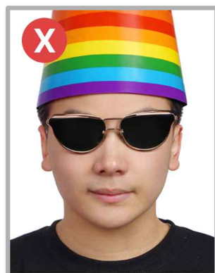
색안경(또는 모자) 착용